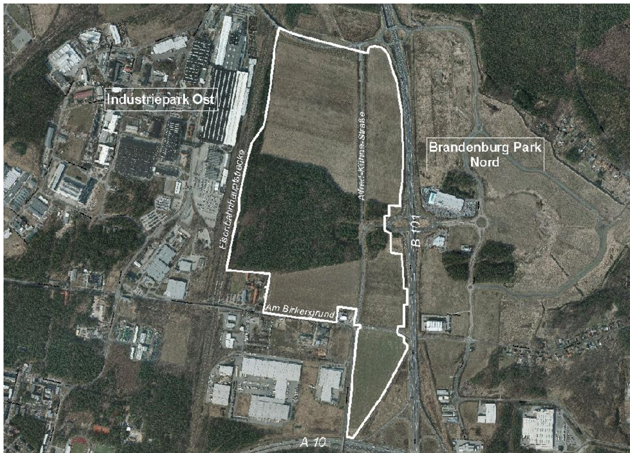
Übersichtsplan mit Stand von 28.08.2013 (ohne Maßstab), nicht Bestandteil der Entwicklungssatzung

Die Lage des Städtebaulichen Entwicklungsbereichs geht aus dem folgenden Übersichtsplan hervor. Dieser Übersichtsplan ist nicht Bestandteil der Entwicklungssatzung. Die genaue Angrenzung des Entwicklungsbereichs ist im Lageplan i. d. F. vom 04.04.2013 (Maßstab 1 : 9.000) dargestellt, welcher Bestandteil der Entwicklungssatzung ist und im Rathaus der Stadt, Sachgebiet Bauleitplanung und Liegenschaften, einzusehen ist.