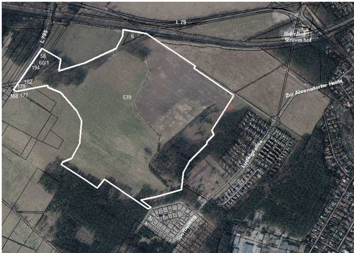
Auszug aus dem Luftbild mit Flurstücken (ohne Maßstab)