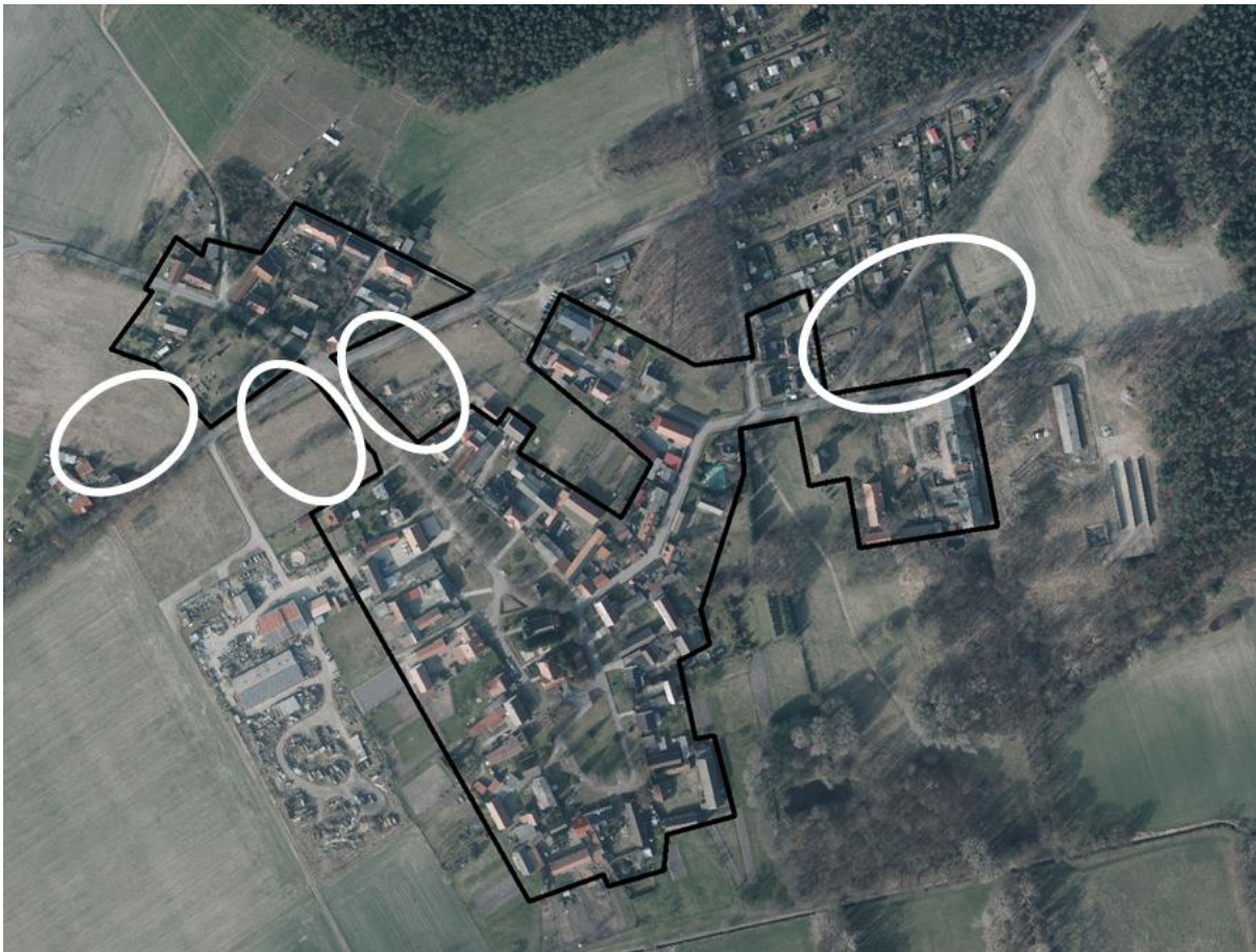
Derzeit rechtskräftige Abrundungssatzung von Kerzendorf, in Kraft seit 14.11.1997, mit Ergänzungsbereichen entsprechend der 11. FNP-Änderung (ohne Maßstab).