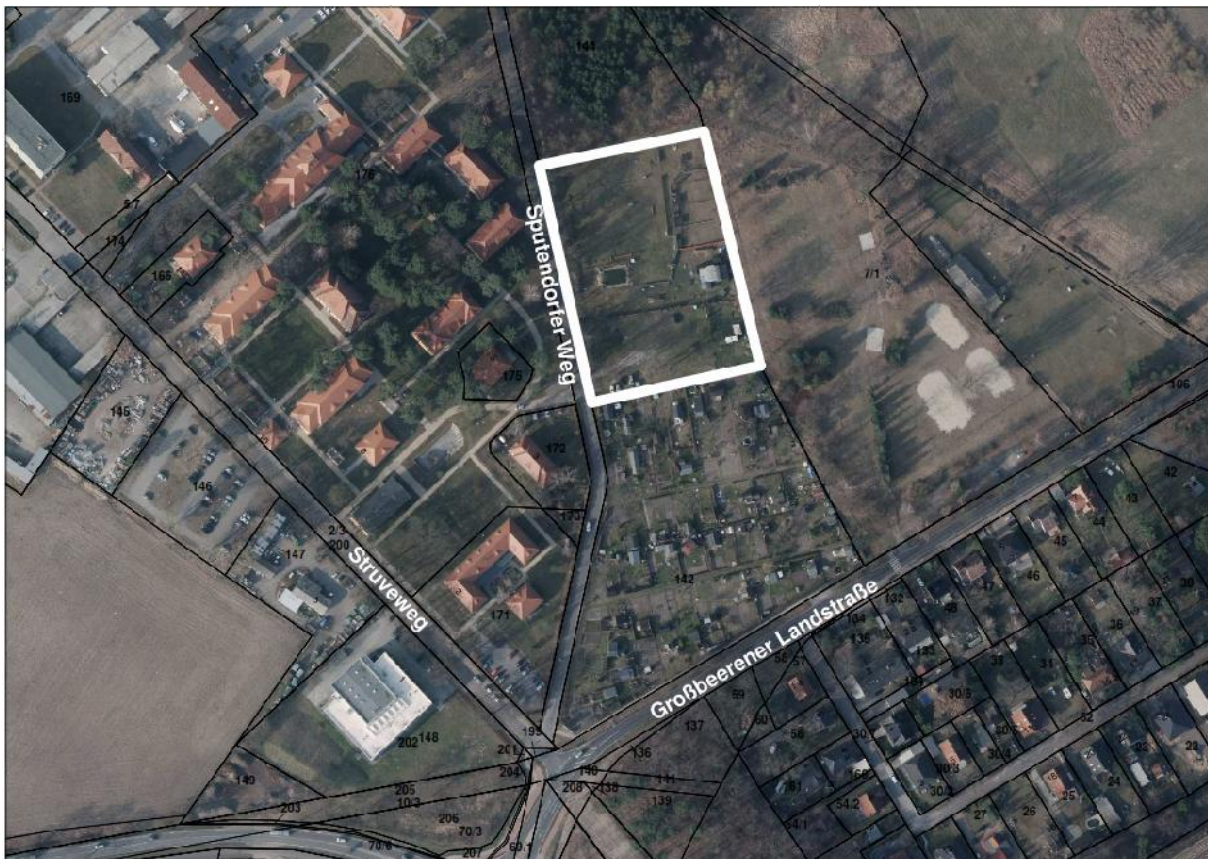
Auszug Luftbild (ohne Maßstab), Stand: 28.04.2016

Der Geltungsbereich umfasst das Flurstück 143 der Flur 14 der Gemarkung Ludwigsfelde und grenzt unmittelbar an den Sputendorfer Weg.