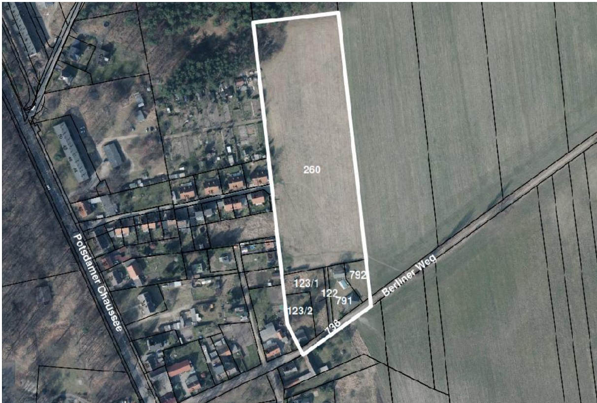
Auszug aus Luftbild mit Flurstücken (ohne Maßstab), Stand: 03.02.2016

Die Stadtverordnetenversammlung Ludwigsfelde hat am 27.01.2015 in öffentlicher Sitzung beschlossen, den Bebauungsplan Nr. 34 „Vorderste Hohe – Wohnbebauung am Berliner Weg“ der Stadt Ludwigsfelde, OT Siethen, gemäß § 2 Abs. 1 BauGB aufzustellen. Der Bebauungsplan wird als Bebauungsplan der Innenentwicklung gemäß § 13a BauGB (Bebauungspläne der Innenentwicklung) im beschleunigten Verfahren aufgestellt. Der Geltungsbereich umfasst in der Flur 8 der Gemarkung Siethen die Flurstücke 122, 123/1, 123(2), 260, 791 und 792 sowie eine Teilfläche des Flurstückes 738. Die genaue Abgrenzung des Geltungsbereichs (ca. 2,4 ha) ist im beiliegenden Kartenausschnitt vom 03.02.2016 dargestellt (ohne Maßstab).