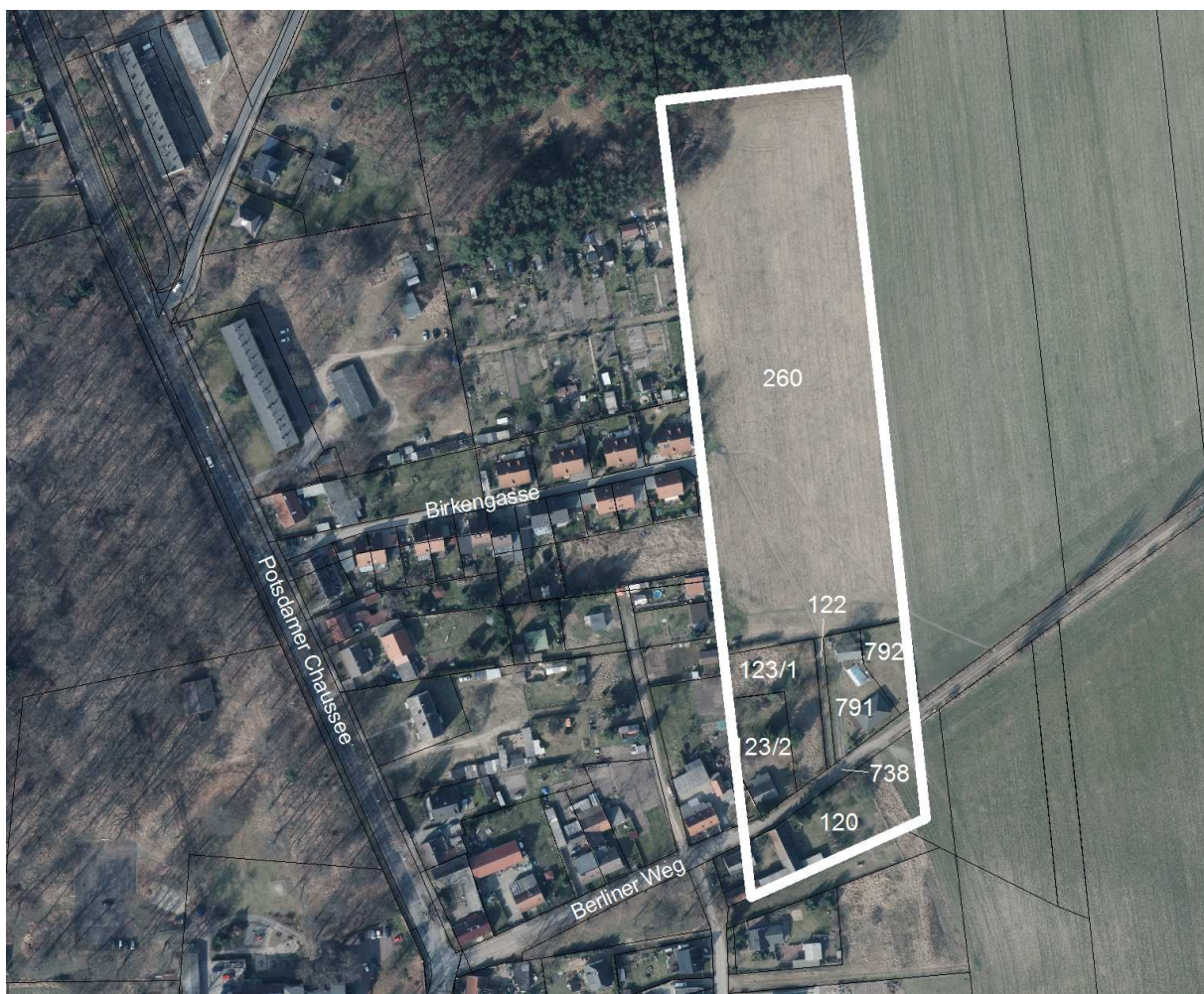
Auszug aus dem Luftbild mit Flurstücken (ohne Maßstab)

Hinweis: Der FNP als vorbereitender Bauleitplan ist nicht grundstücks-/parzellenscharf. Seine Darstellungsschwelle liegt bei 0,5 ha.