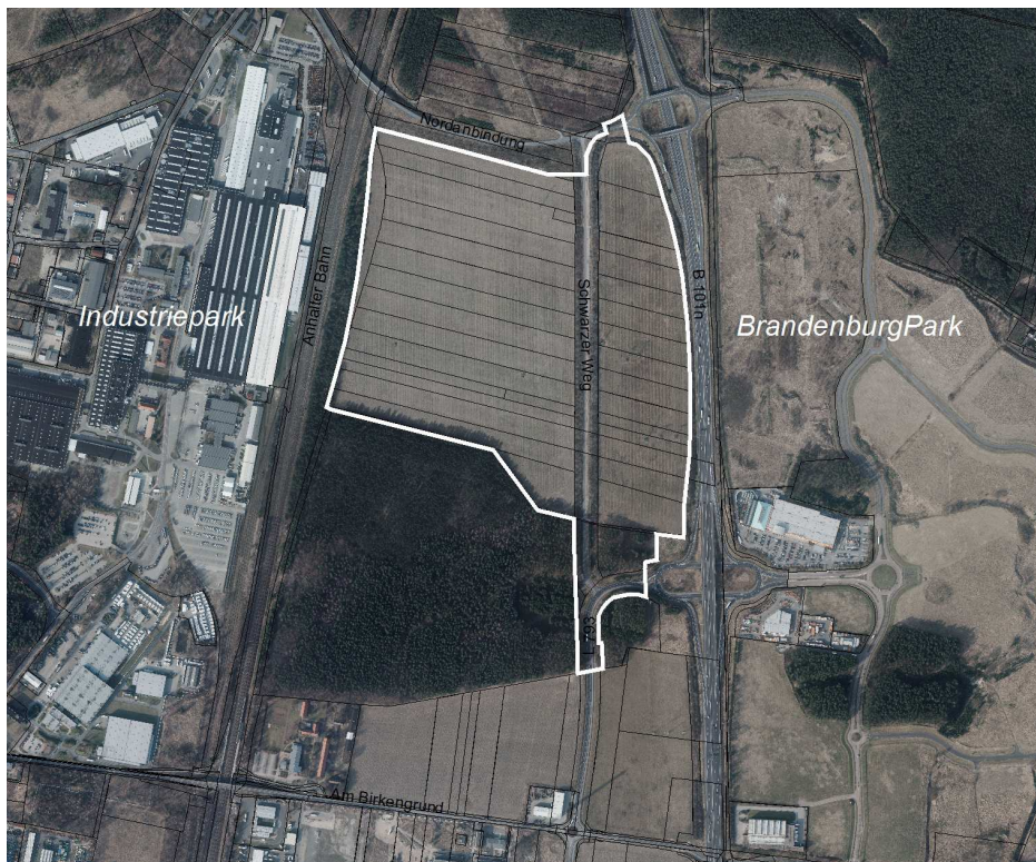
Geltungsbereich B-Plan 39 „An der Eichspitze Nord“ der Stadt Ludwigsfelde, Ortsteil Genshagen (weiß), Auszug aus Luftbild vom 05.01.2017 (ohne Maßstab)

Der Flächennutzungsplan als vorbereitender Bauleitplan ist nicht grundstücks- oder parzellenscharf. Seine Darstellungsschwelle liegt zudem bei 0,5 ha.