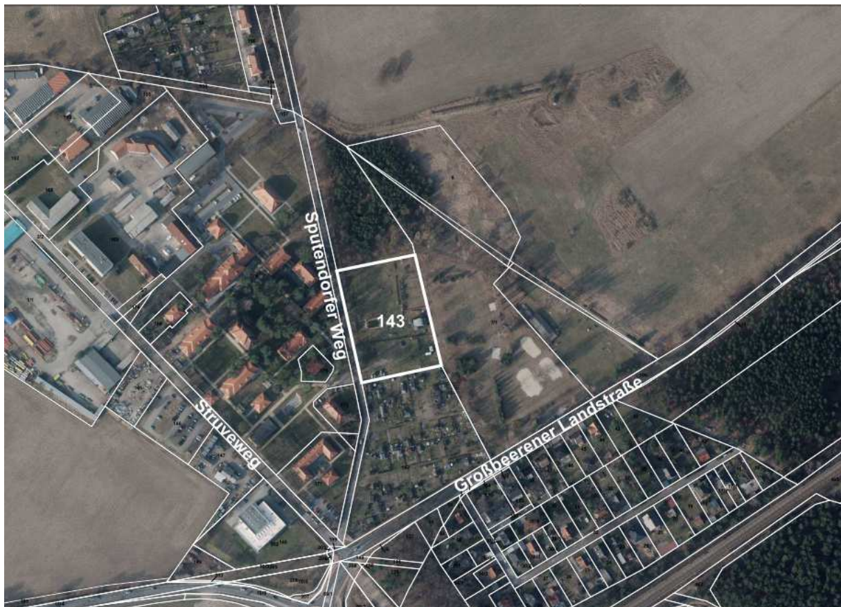
Lageplan vom 07.07.2015

Für den räumlichen Geltungsbereich des Bebauungsplanes ist der Lageplan vom 07.07.2015 maßgebend.